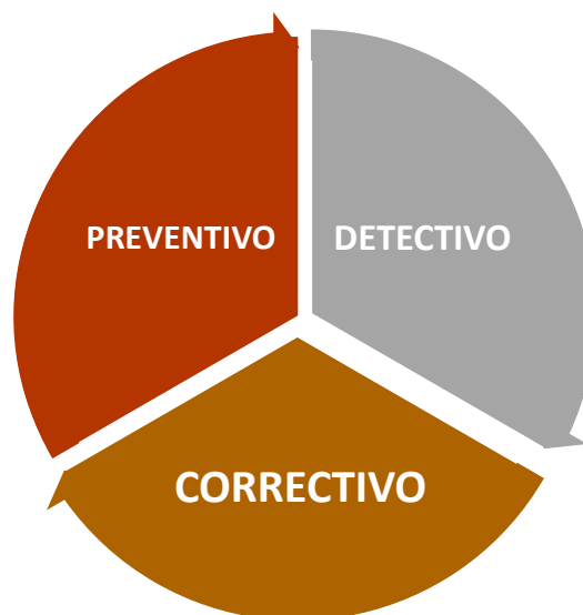
FIGURA N° 02: TIPOS DE CONTROL INTERNO