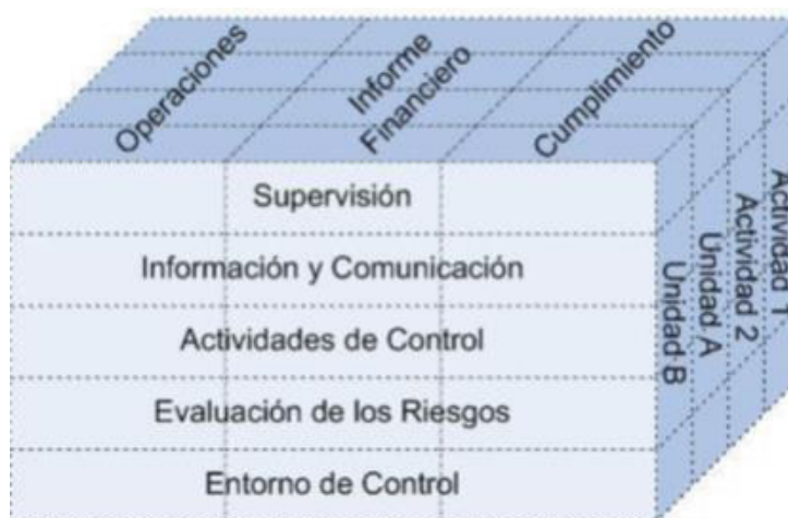
FIGURA N° 03: RELACIÓN ENTRE OBJETIVOS Y COMPONENTES DEL CONTROL INTERNO

Existe sinergia e interrelación entre los componentes del control interno, formando un todo, un sistema integrado que reacciona dinámicamente a las condiciones cambiantes. Están entrelazados con las actividades de operación de la entidad y existen por razones fundamentales de negocios. El control interno es más efectivo cuando los controles se construyen en la infraestructura de la entidad y son parte de la esencia de la empresa. Construir en los controles apoya la calidad y las iniciativas y evita costos innecesarios y permite respuestas rápidas a las condiciones cambiantes. Podemos definir herramientas fundamentales y necesarias para llevar a feliz término la construcción de un buen sistema de control interno.